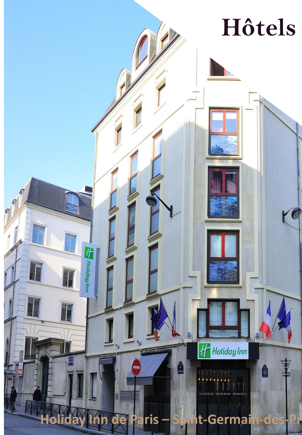
Holiday Inn de Paris – Saint-Germain-des-Prés