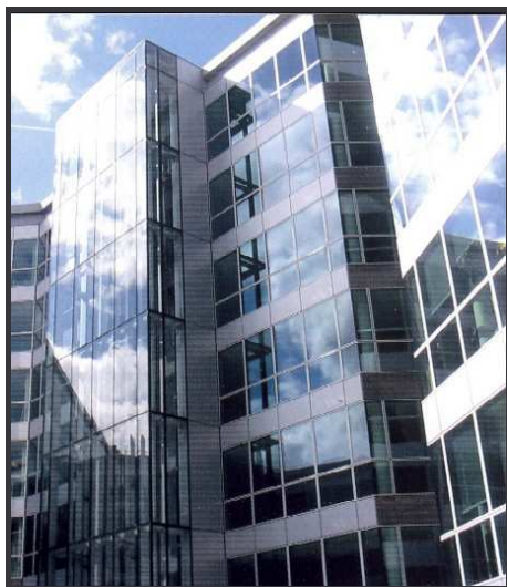
Les Portes de la Défense